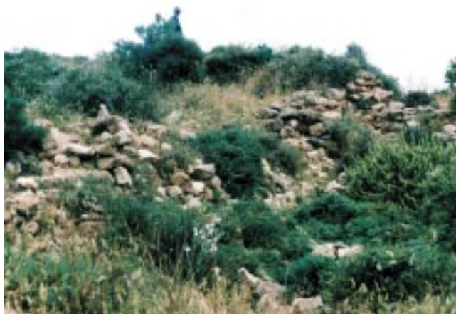
Ruinas en la actualidad