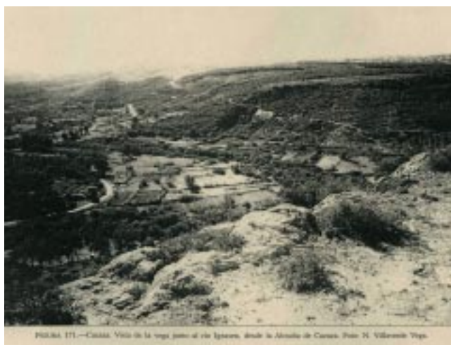
Vista de la vega junto al río

Muchas otras informaciones son aportadas por los textos árabes así como por los archivos cristianos de los siglos XIV y XV que concuerdan en señalar que Gassasa era uno de los puertos más activos de Marruecos, donde se importaba artículos de lujo y se recibía a eminentes personajes. Después del asentamiento español sobre Melilla en 1497, Ghasassa fue ocupada por mandato del duque de Medina Sidonia en 1506 y reconquistada por los musulmanes de Tazuda en 1532 15 , pero se abandonaría poco tiempo después. León el africano describía una ciudad rodeada por una muralla y un puerto frecuentado por los Valencianos 16 . Por su parte, Mármol Carvajal "el granadino" ya hacía referencia a sus ruinas y señalaba los restos de un antiguo palacio 17 .