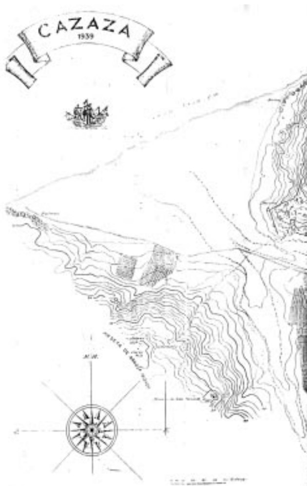
Plano de Cazaza

Fuentes medievales y posmedievales (musulmanas y europeas) que mencionan a Gassasa