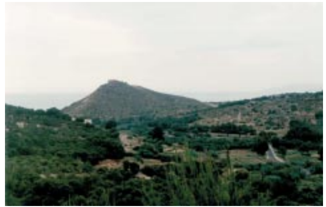
Altura de Cazaza

La ciudad de Gassasa reviste una cierta importancia a partir del siglo XIII y es mencionada en la siguiente centuria por diferentes autores árabes y por fuentes europeas que citan el puerto de Alcudia por su papel económico y portuario. En este contexto, habría podido rivalizar con otros grandes puertos y ciudades comerciales como Mezemma, Badis, Nekur o Fes. Esto podría indicar que una buena parte de las actividades comerciales de la región habrían sido desplazadas hacia Gassasa, causando la decadencia de Melilla 27 . Su apogeo en este periodo no debe sorprendernos, visto el emplazamiento estratégico de la ciudad dentro del dispositivo general defensivo de la costa norte de al-Maghrib al-Aqsa y también fue importante su papel comercial y económico con los puertos europeos, especialmente Venecia 28 .