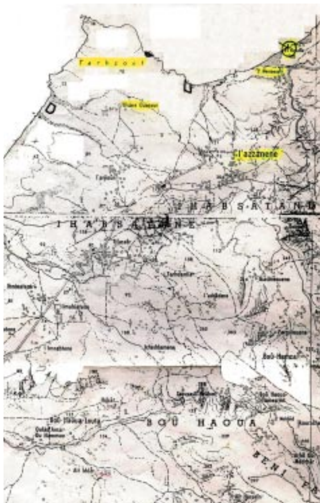
Plano del entorno de Cazaza