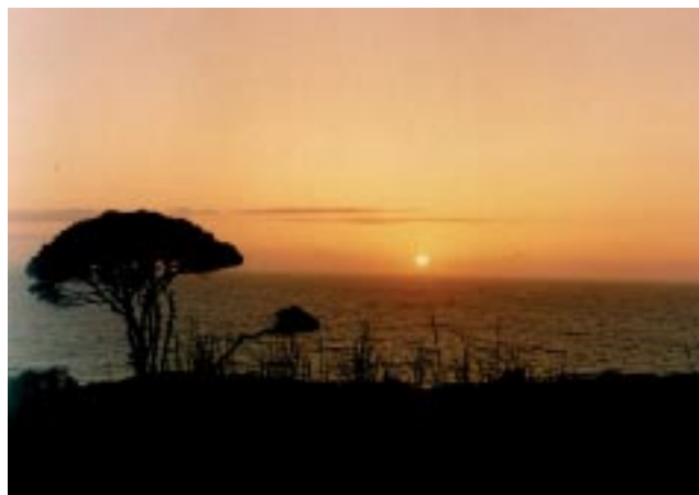
Playa de Cazaza