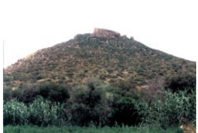
Detalle de la altura