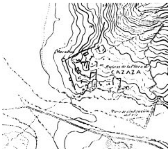
Plano de la excavación