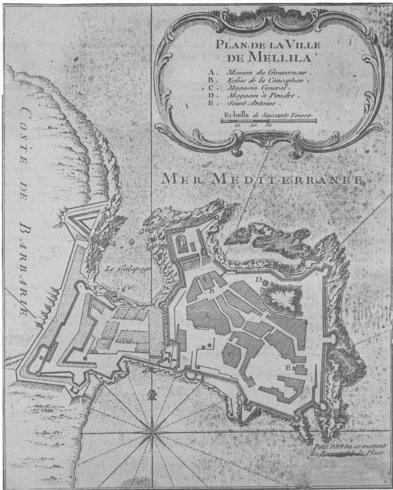
XVIII-13-A; 1713. Plan de la Ville de Melilla. A.P.