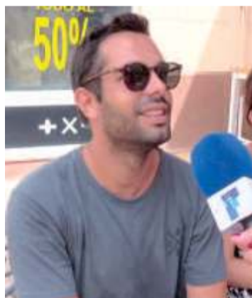
Juan Todo lo que sea traer actividades a Melilla me parece bien porque revitaliza la ciudad..