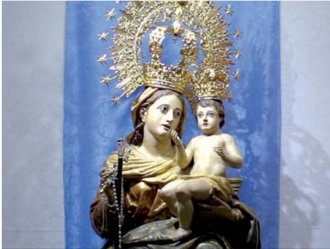
Imagen de Nuestra Señora la Virgen de la Victoria, Patrona y Alcaldesa perpétua de Melilla.

Nuestra Señora la Virgen de la Victoria fue reconocida por la ciudadanía católica melillense antes de que lo fuese oficialmente en 1756 por el Rey Fernando VI que fue quien ratificó dicho patronazgo. La citada advocación religiosa estaba destinada a las colonias españolas en el continente americano, sin embargo, cada vez que salía del puerto el barco que la transportaba había una fuerte tempe-