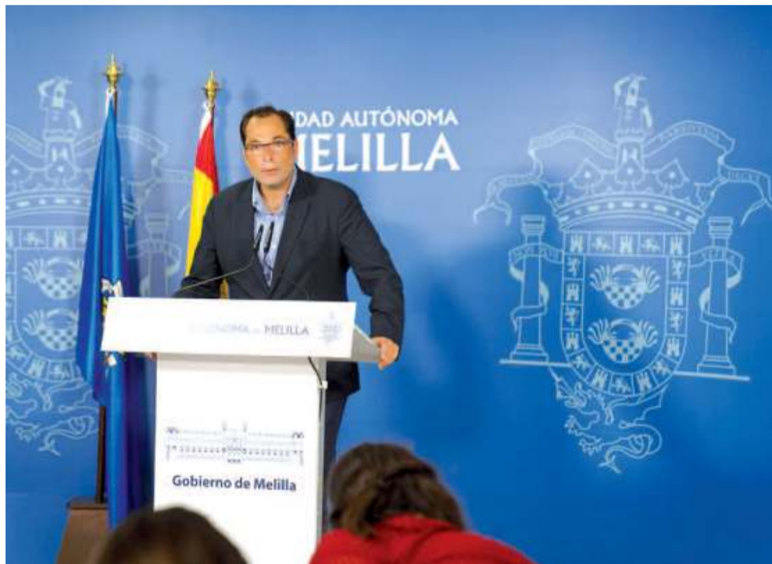
El diputado delegado de Asuntos Universitarios apuesta fuerte por la atracción de congresos.

También este mismo mes, pero los días 12, 13, 14 y 15 de marzo se pondrá en marcha el XVI congreso de la Sección de Dirección Operaciones y Tecnología de la Asociación Científica de Economía y Dirección de la Empresa. En este caso, se espera la