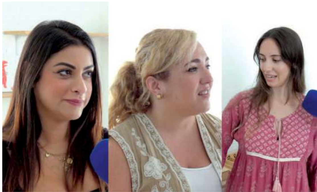
Las trabajadoras del centro explicaron el desarrollo de clases y talleres.

Reapertura El próximo 2 de septiembre comienza de nuevo en Melilla esta guardería de aprendizaje vivo y activo