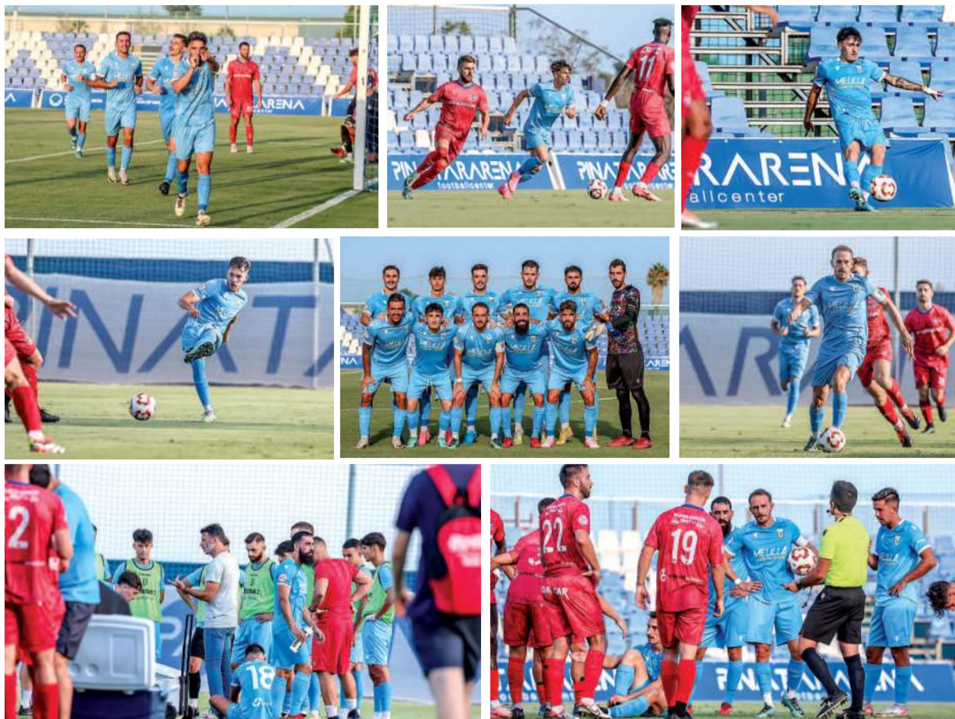
Imágenes del encuentro melillenses y unionistas en el Pinatar Arena.