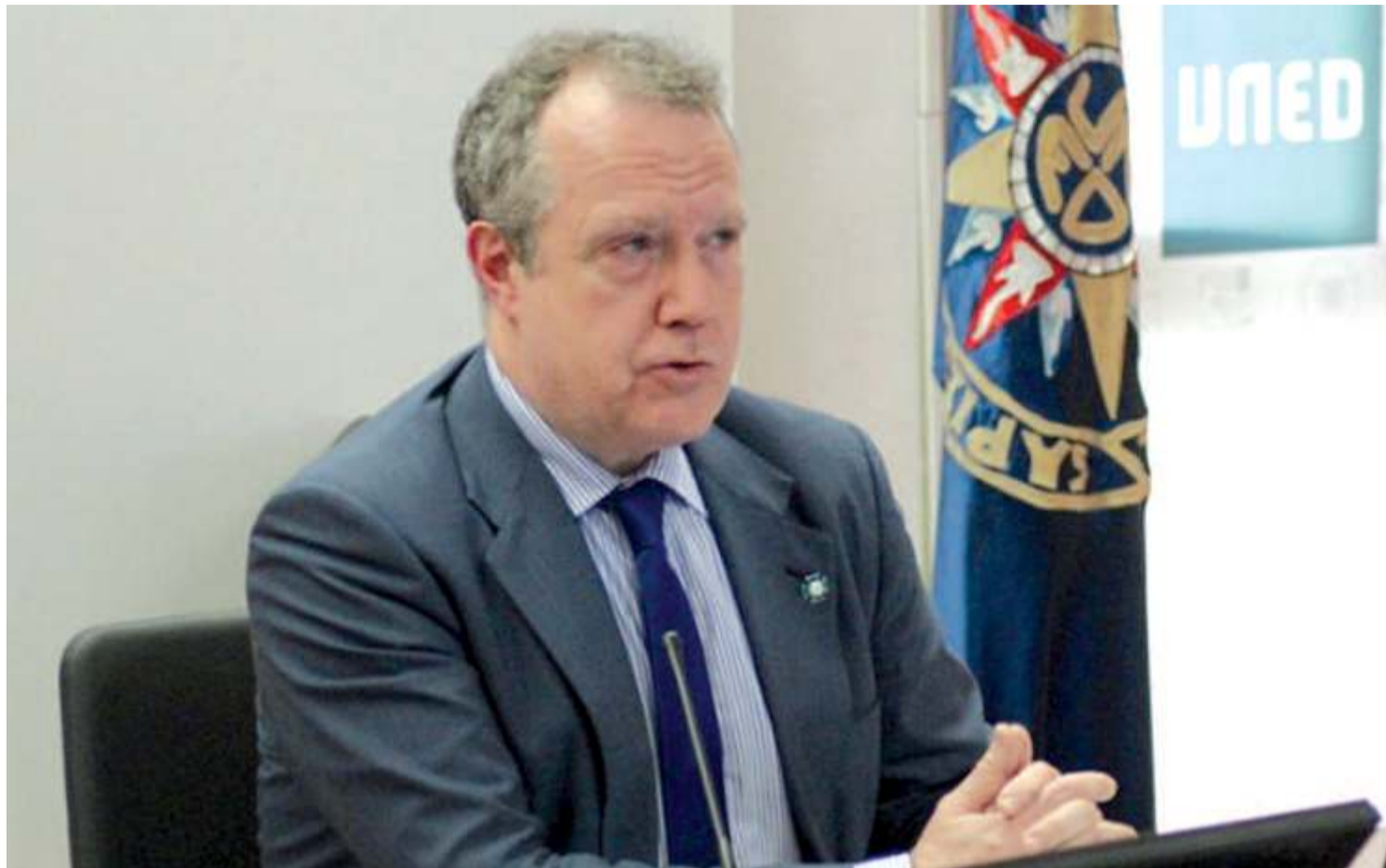
El director del Observatorio de Ceuta y Melilla admite que la noticia puede tener “un alto impacto”, pero aboga por abordar los escenarios con calma.