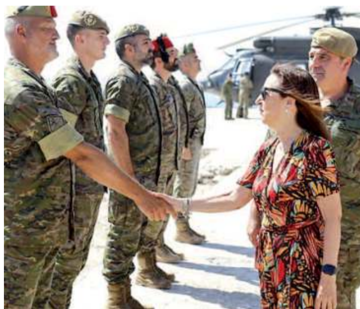
La ministra de Defensa, Margarita Robles.

La ministra ha recordado que, aunque estén alejados de la Pe-