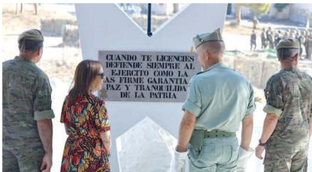
Imágenes de la visita de la ministra de Defensa, Margarita Robles, a los peñones en la isla Isabel II de Chafarinas.