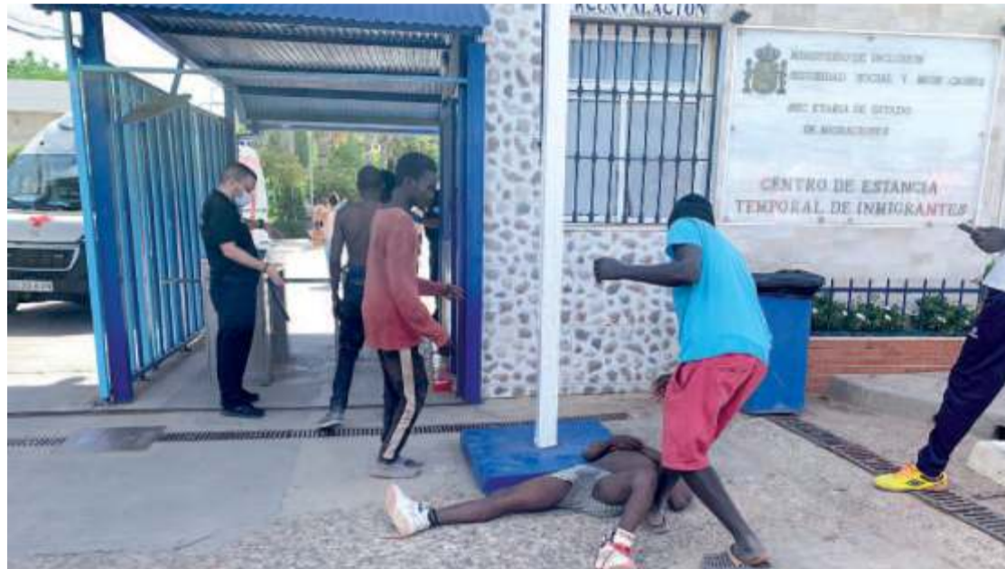
Imagen del Centro de Estancia Temporal de Inmigrantes (CETI) en Melilla.

Asimismo, considera necesario un incremento del personal administrativo de los expedientes en las oficinas de asilo y dotar de más medios materiales y humanos a la Comisaría General de Extranjería