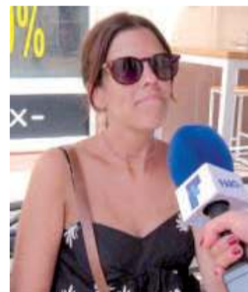
Marta Me parecen bien, ya que es una forma de incentivar a los jóvenes.