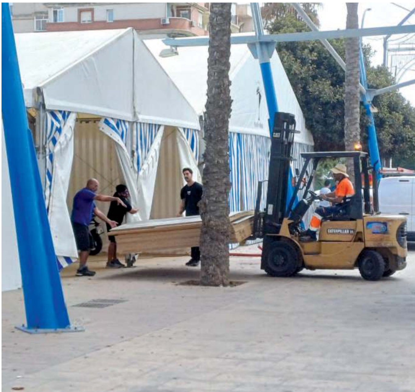
Feria de Melilla. A diez días del inicio de los festejos patronales de septiembre, el Real es un hervidero de personas preparando toda la infraestructura ▶10-11