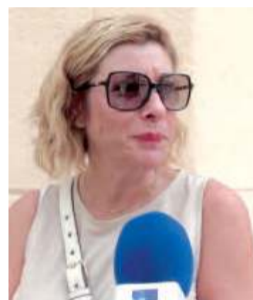
Elena No me importa que se celebre, pero no iré a verla. No es algo que me llame la atención.