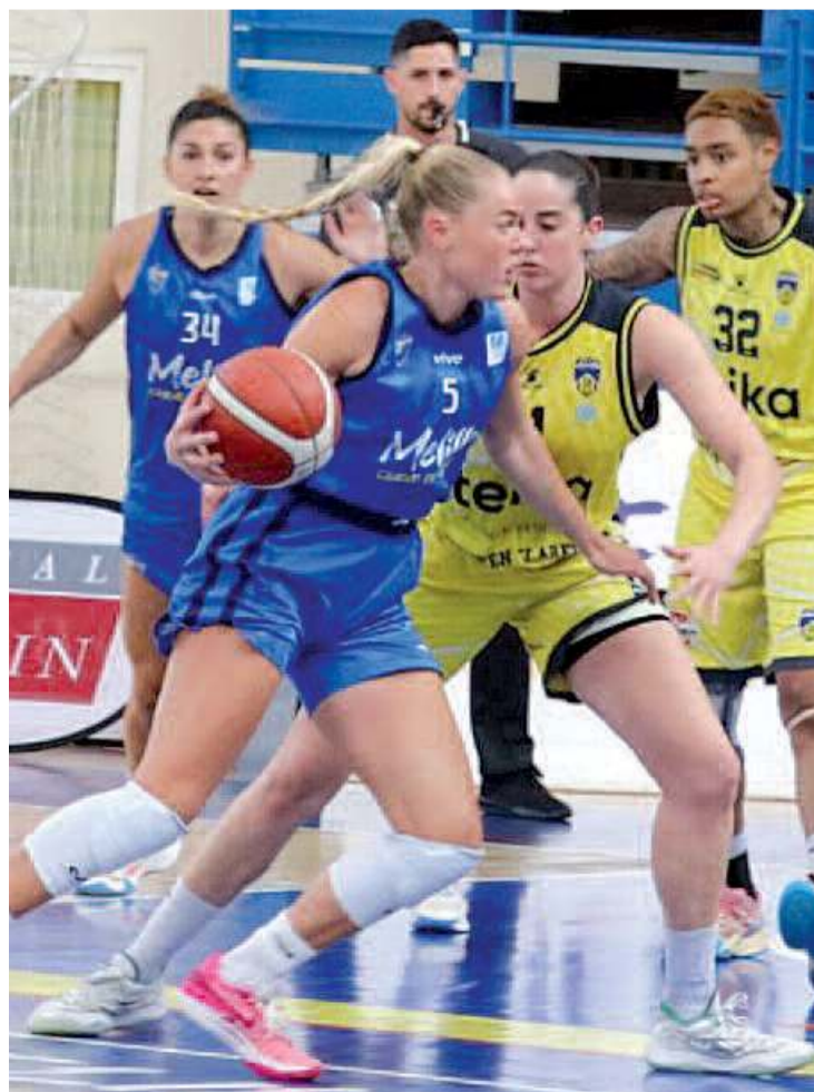
Imagen de uno de los partidos de la pasada liga.

Chile, donde se convertirá en una de las piezas más importantes dentro de los esquemas de juego del técnico de la escuadra albiceleste. El MCD La Salle tiene programado afrontar su primer test de preparación el 8 de septiembre, desplazándose en esa fecha a la ciudad de La Alhambra para medirse al GMSB, conjunto de la Liga Femenina 2. Posteriormente, el fin de semana del 14 y 15 de septiembre, las melillenses participarán en la capital de España en un torneo que organiza el Innova-Tsn Leganés, rival en la Liga Challenge.