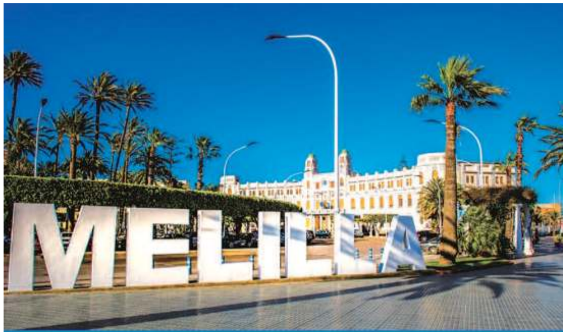
Melilla reúne todos los mimbres para convertirse en una ciudad universitaria.