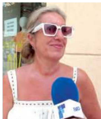
Yoli Me parece bien que se organice este concurso y los jóvenes se animen. Después siempre me gusta saber quién ha ganado.