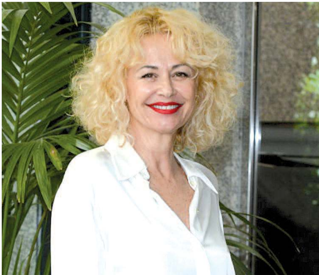
La actriz Esther Arroyo se estrena en el teatro con el papel protagonista de la obra.