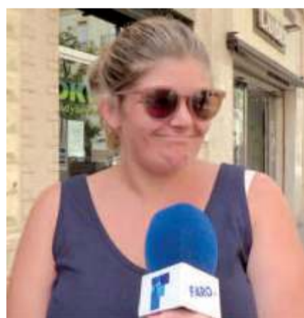
Rocío Para mí no es una gala entretenida. No tengo previsto verla.