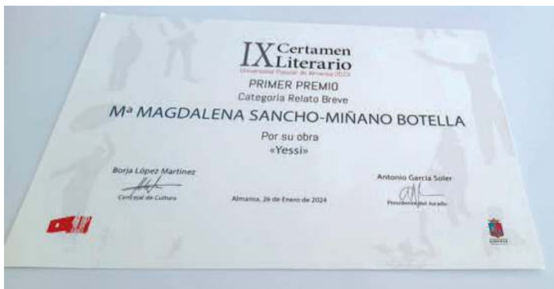
Credencial que muestra a la escritora melillense como ganadora del premio de la Universidad Popular de Almansa.