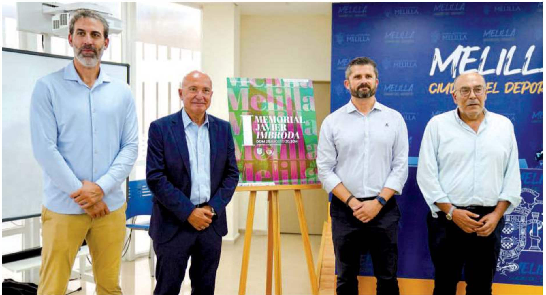
Foto de familia con el cartel de este partido que se jugará en el pabellón Javier Imbroda Ortiz.