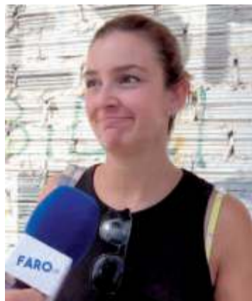
Lourdes Me parece bonito. Lleva muchos años celebrándose esta gala y me parece bien.