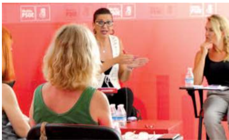
Reunión con representantes de los sindicatos CCOO y UGT en la sede del PSOE.