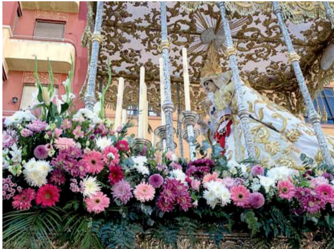
La Virgen del Rocío, protagonista del encuentro de resurrección más bonita de España.