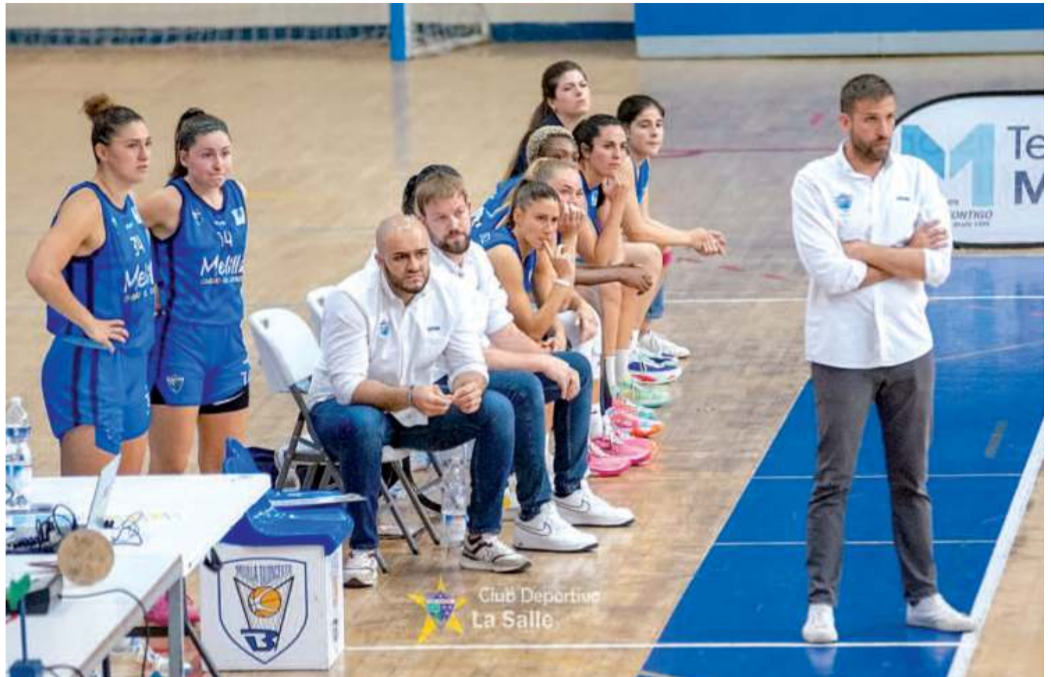
Los componentes del cuerpo técnico serán los mismos que durante la temporada pasada.