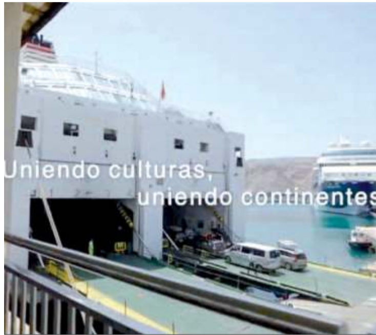
La naviera es una pieza clave para facilitarles el viaje y su vuelta a Europa.

Entre el 15 de junio y el 15 de septiembre Armas Trasmediterránea