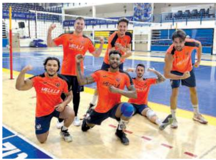
Jugadores del CV Melilla en el entrenamiento de este lunes.

Las sesiones de entrenamientos de la presente pretemporada se irán intercalando con la disputa de los correspondientes partidos amisto-