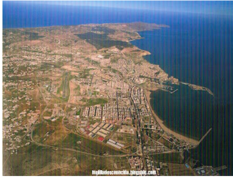
Vista aérea de la Ciudad desde el Sur en la que se aprecia el Cabo Tres Forcas

Hace unos días estábamos jugando al parchís por internet. Como es normal, los jugadores suelen presentarse y decir de dónde son. El primero dijo: Valencia, el segundo señaló: Oviedo, el tercero dijo que era de México y finalmente nosotros indicamos que éramos de Melilla. Rápidamente el de México comentó que de allí era la "Reina del Sur", con lo que dedujimos que había visto la famosa serie originada a partir del libro de Pérez Reverte. Pero lo que más me sorprendió fue la contestación de la chica de Oviedo, que indicó que Melilla estaba en Marruecos, y que no sabía que allí se hablase castellano. Es sorprendente, que todavía halla gente que crea que Melilla no pertenece a España o que piensen que esta ciudad es una colonia española. Así que para todos ellos, vamos a dedicar esta entrada a descifrar, dónde está Melilla, que por otra parte es España.