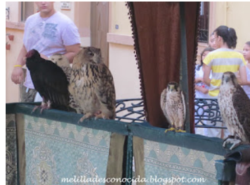
Halcones y lechuzas en el Mercado Medieval

Halcones peregrinos, cernícalos y ratoneros durante el día y lechuzas, mochuelos y cárabos de noche, constituyen nuestro elenco de depredadores. La gran diversidad de aves, con más de cien especies citadas, se justifica por la existencia de vías migratorias que atraviesan el cabo Tres Forcas en dirección norte-sur, entre Europa y África, y este-oeste en el caso de aves marinas que entran y salen regularmente del Mediterráneo.