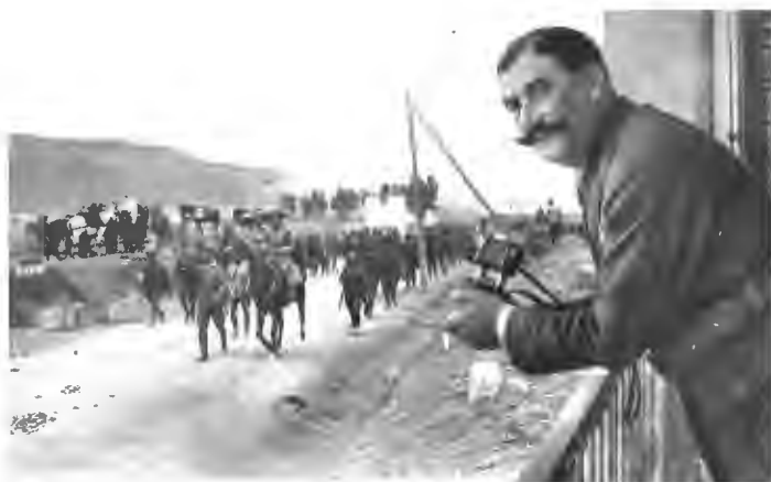
El general Dámaso Berenguer, alto comisario de España en Marruecos, viendo pasar las tropas en 1921. Revista Ilustrada Mundo Gráfico.

La creación de dos comisiones parlamentarias y el suplicatorio del Senado contra el general Berenguer , acusado de negligencia, fueron las principales medidas emprendidas para juzgar los hechos. Estas acciones se efectuaron casi únicamente contra militares , pero las responsabilidades de los políticos en la catástrofe resultaba evidente , y contra ellos se lanzaron importantes críticas en el Congreso.