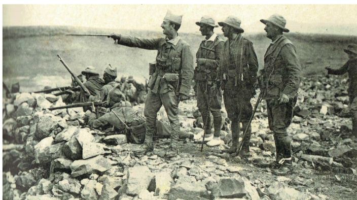
El comandante Franco del Tercio, dando órdenes a sus oficiales para el asalto de Ras Medua, 1921.

Aunque es de todos conocida la situación de las tropas españolas en aquel momento, S CONTACTANOS | CONTACT US no se justifica con ello el caos y la descordinación de la que fueron partícipes soldados, oficiales y jefes. Para comprender aquella derrota, solo puede hacerse a través de la constatación de una grave sucesión de errores de los mandos, tanto antes del Desastre, en un despliegue militar demasiado ambicioso y precipitado, como en las decisiones inmediatas tomadas cuando comienzan a caer las primeras posiciones.