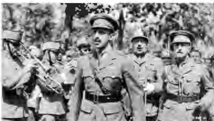
El rey Alfonso XIII junto al capitán general de Cataluña, Primo de Rivera, en 1922.

parte fundamental del Informe realizado por el general Picasso , que no ha sido p CONTÁCTANOS p, CONTACT US Jnta a que, entre estos documentos, se encuentran algunos de los que se habían perdido. Por tanto, el informe judicial de Picasso puede seguir aportando información que ayude a esclarecer unos hechos de los que siempre fue la principal fuente de conocimiento.