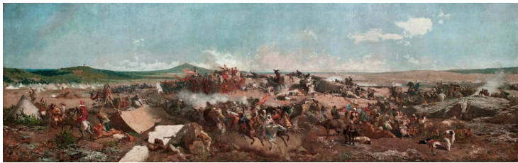
La batalla de Tetuán, obra de Mariano Fortuny, 1862-64 (Museo Nacional de Arte de Cataluña).

hacinamiento de las tropas , y las insuficientes condiciones sanitarias , causaron un volumen considerable de muertes por enfermedad, tantas que duplicaron la cifra de los muertos en combate.