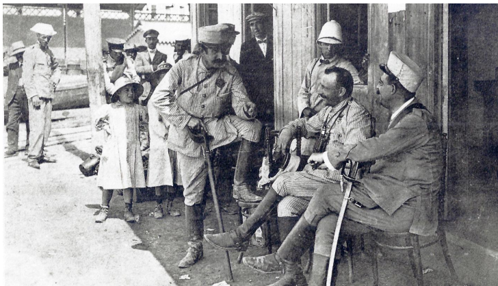
El general Miguel Primo de Rivera y otros militares en el puerto de Melilla, 1919.

En este contexto, la línea cronológica de la última, y más dramática, de las campañas militares de España en Marruecos, marca su abrupto inicio con el denominado «Desastre de Annual», que conmocionó a España y supuso la difusión mundial de la figura de Abd el-Krim, el líder de la resistencia rifeña, considerado despectivamente por muchos españoles como el hijo de un sastrecillo de chilabas.