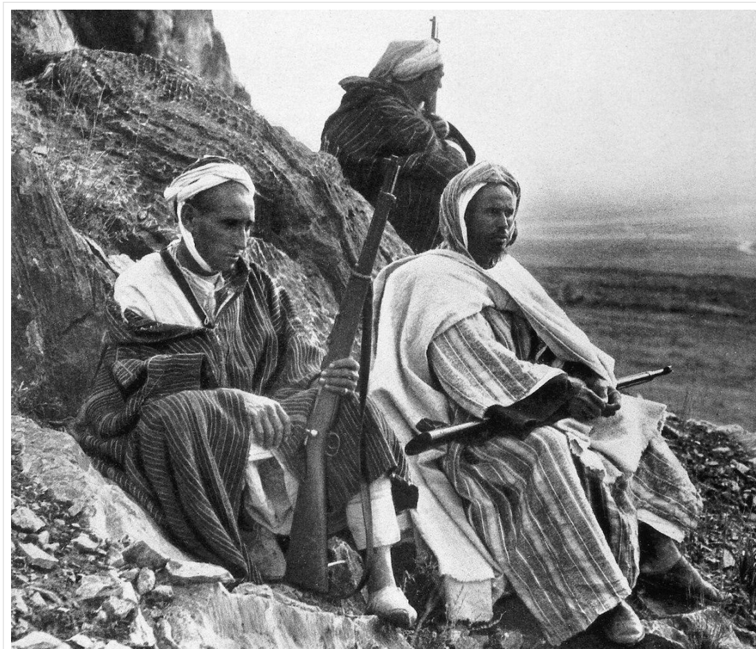
Harqueños rifeños en la Yebala, durante la Guerra del Rif. Imagen del libro A cien años de Annual. La guerra de Marruecos .

En 1956 Marruecos accedía a la independencia, y no tardó en plantearse el problema de la integración de la zona norte en el resto del país. La unificación lingüística significó que el francés sustituyera al español en la escuela y en la administración. Al no disponer de personal francófono, hubo que recurrir a administradores francoparlantes de otras regiones del país, lo que causó un manifiesto malestar entre los rifeños al verse invadidos por personas del antiguo Protectorado francés, que los miraban por encima del hombro como a seres inferiores. Esta situación llevó a una marginación de la población de la zona norte, y terminó por generar un profundo resentimiento hacia los llegados del exterior, en general miembros del Partido del Istiqlal.