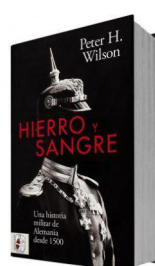
Hierro y sangre. Una historia militar de