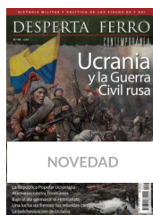
Ucrania y la Guerra Civil rusa Desperta Ferro Contemporánea