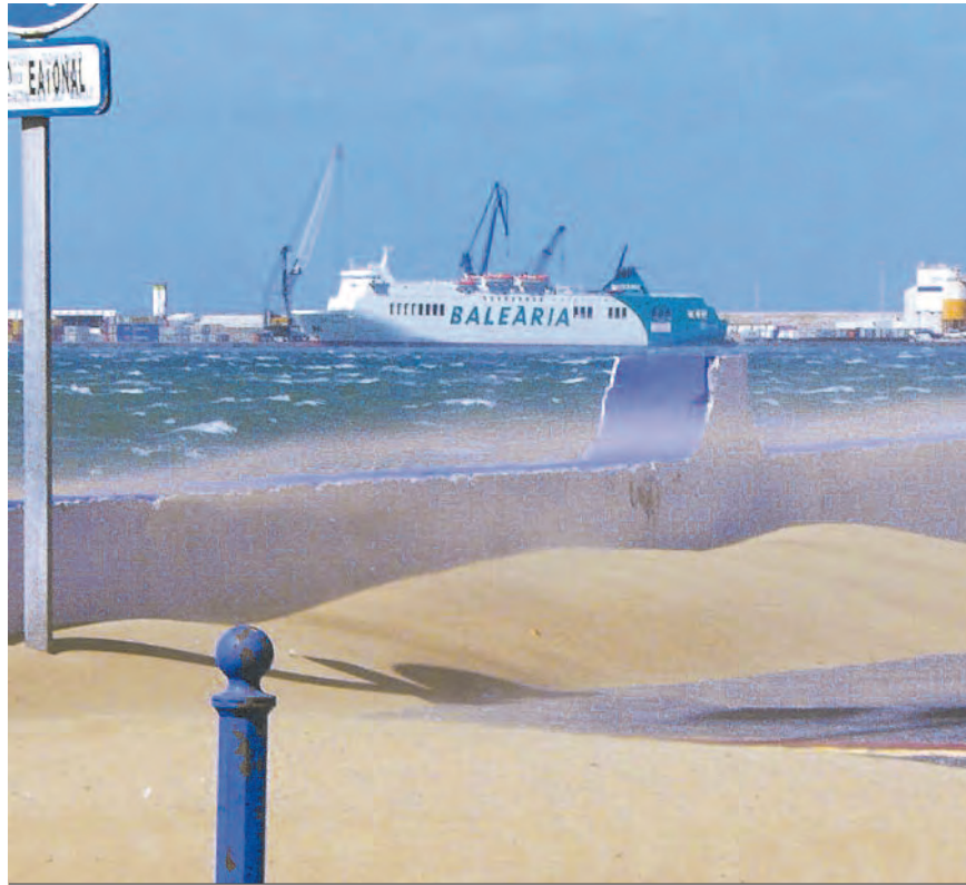
El temporal, que hoy amaina, se dejó sentir ayer en la ciudad de Melilla.

● La alerta remitirá hoy a partir de las 10:00 horas, aunque habrá probabilidad de lluvias durante toda la jornada